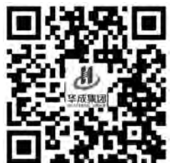
更多精彩内容请关注华成官网