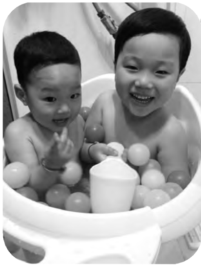
你们两个永远这样相亲相爱,妈妈会很欣慰! 金诚小贷 何芳