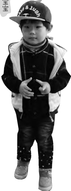
“嘿嘿嘿嘿,祝弟弟健康成长!嘿嘿嘿嘿,原弟弟快乐每天!嘿嘿嘿嘿,这是妈妈最大的心愿!” 金诚小贷 于洪潮