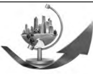
华成转型升级新关注